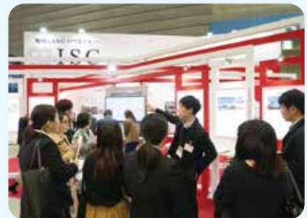
ビジネスフェア見学ツアー